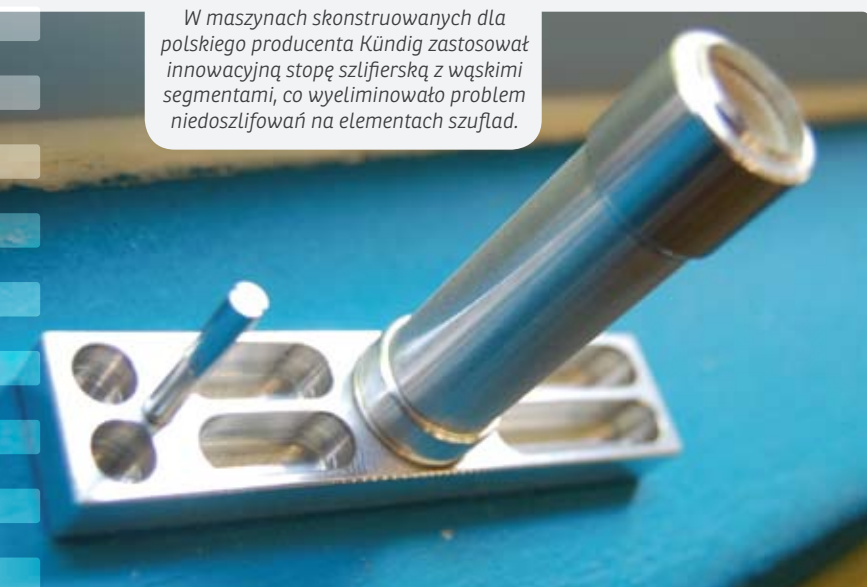
W maszynach skonstruowanych dla polskiego producenta Kündig zastosował innowacyjną stopę szlifierską z wąskimi segmentami, co wyeliminowało problem niedoszlifowań na elementach szuflad.

powierzchni. Agregat ten może pracować również prostopadle do transportera, a przesunięcie o 10 stopni możliwe jest poprzez zmianę jednej z osi podparcia.