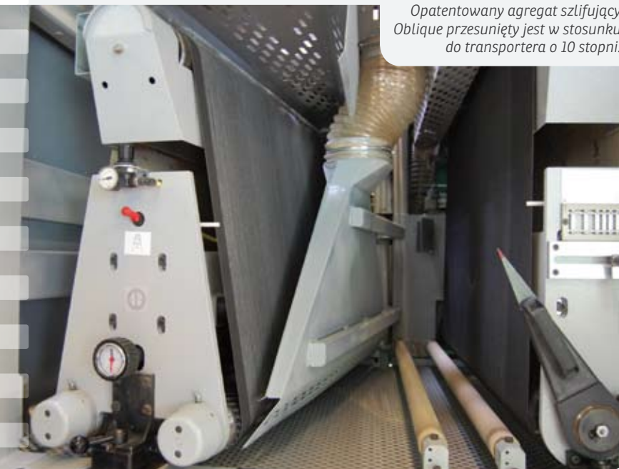
Opatentowany agregat szlifujący Oblique przesunięty jest w stosunku do transportera o 10 stopni.