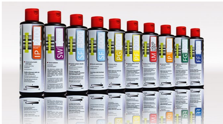
Pasty i mleczka polerskie.

■ RED LINE – jest to grupa produktów uzupełniających, w skład których wchodzi woski zabezpieczające oraz płyn do kontroli polerowanej powierzchni. Wosk nakłada się na wypolerowaną powierzchnię w celu