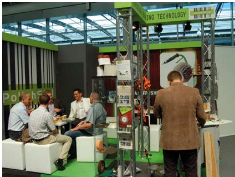
PolishStyl na targach LIGNA 2011.

jącego włókna i przygotowanie do bejcowania lub lakierowania. Strukturyzacja drewna miękkiego jest możliwa już przy zastosowaniu obróbki dwuetapowej, której pierwszym etapem jest strukturyzacja za pomocą szczotki tyneksowej. Agresywność tej szczotki pozwala na wybranie drewna wczesnego miękkich gatunków. W drugim etapie należy zastosować głowicę z wymiennym systemem szczotek ściernych, które – tak jak w przypadku drewna twardego – mają za zadanie wyszlifować nierówną powierzchnię, wyciąć wystające włókna i przygotować do lakierowania. Procesy strukturyzacji można w dowolny sposób modyfikować, uzyskując różne efekty poprzez dodawanie lub ujmowanie etapów, i zamiast zastosowania jednej głowicy metalowej, jednej szczotki ścierniej, można zastosować dwie głowice druciane, dwie głowice tyneksowe oraz dwie głowice szczotkowe lub w innych konfiguracjach – w zależności od wymaganego efektu i parku maszynowego. Intensywność procesów strukturyzacji można również regulować poprzez prędkości obrotowe wrzecion oraz prędkość posuwu elementów, a także siłę docisku głowicy do elementu. Najlepsze efekty strukturyzacji uzyskuje się na gatunkach drewna pierścieniowo-naczyniowych, takich jak na przykład dąb, jesion oraz gatunkach iglastych, takich jak sosna, świerk.