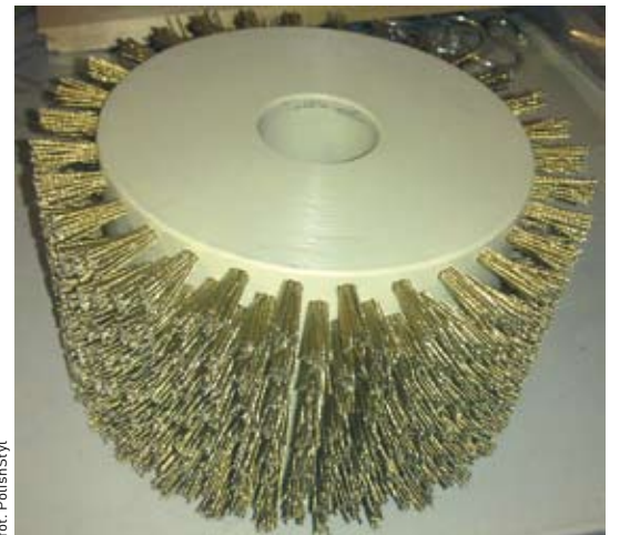
W pierwszym etapie strukturyzacji używa się głowicy stalowej.

Są to głowice z włosiem metalowym oraz głowice z włosiem z tyneksu, z wtopionym materiałem ściernym.