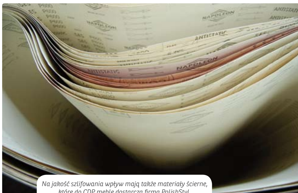
Na jakość szlifowania wpływ mają także materiały ściernie, które do CDP meble dostarcza firma PolishStyl.

– Potencjału tej maszyny nie byliśmy w stanie wykorzystać, gdyż z uwagi na wspomniany brak przedstawicielstwa w Polsce nie mogliśmy znaleźć specjalistów, którzy chcieliby podjąć się jej serwisu i naprawy zwłaszcza po tym, kiedy w wyniku kolizji elementów został zniszczony wał kalibrujący – dodaje