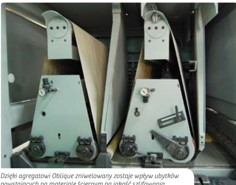
Dzięki agregatowi Oblique zniwelowany zostaje wpływ ubytków powstających na materiale ściernym na jakość szlifowania.