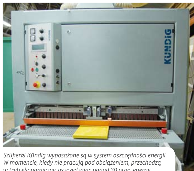
Szlifierki Kündig wyposażone są w system oszczędności energii. W momencie, kiedy nie pracują pod obciążeniem, przechodzą w tryb ekonomiczny, oszczędzając ponad 30 proc. energii.

około dwóch lat temu, po przybyciu przedstawicieli z firmy Kündig Polska, poznaliśmy jej potencjał, dzięki czemu obecnie możemy wykorzystywać ją na 100 proc. jej możliwości – zaznacza Krzysztof Szostak.