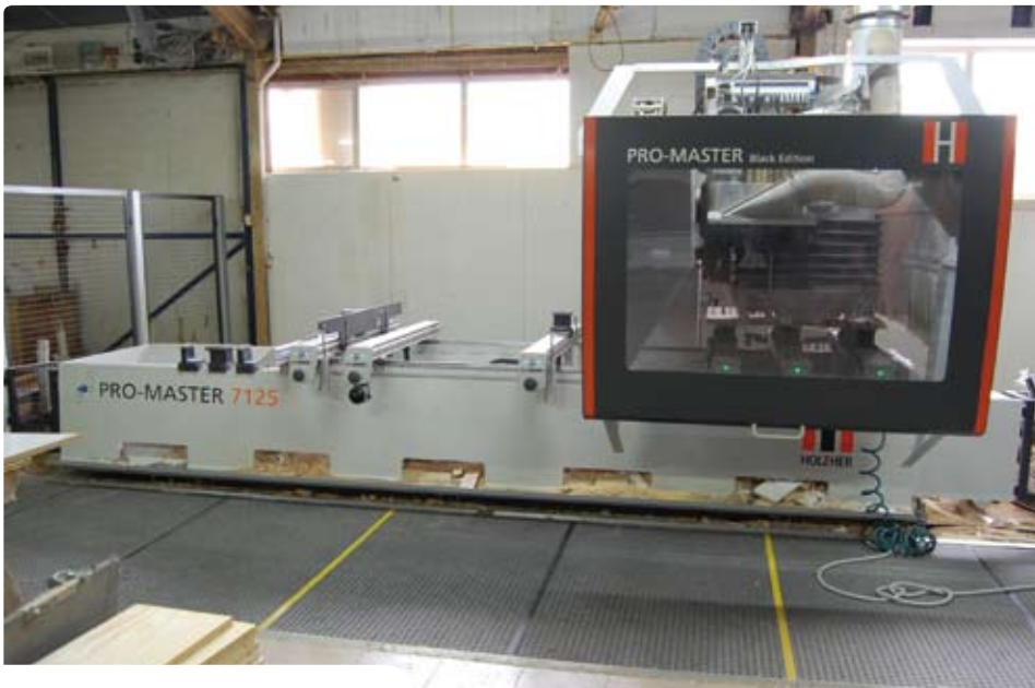
Centrum obróbcze i pilarka panelowa to najnowsze inwestycje rozbudowujące park maszynowy firmy.