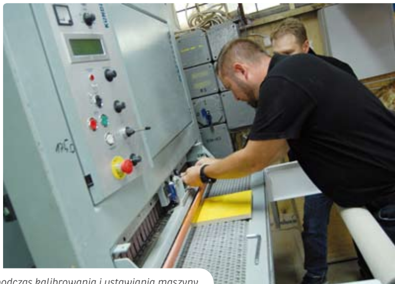
Przedstawiciele firmy Kündig Polska podczas kalibrowania i ustawiania maszyny.