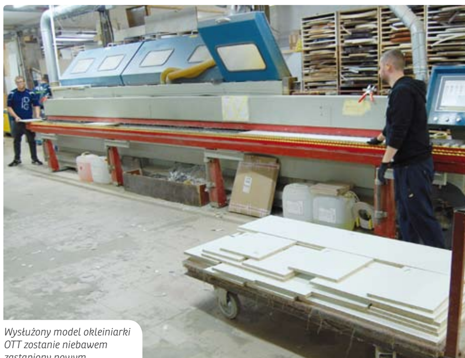
Wyświetlony model okleiniarki OTT zostanie niebawem zastąpiony nowym.